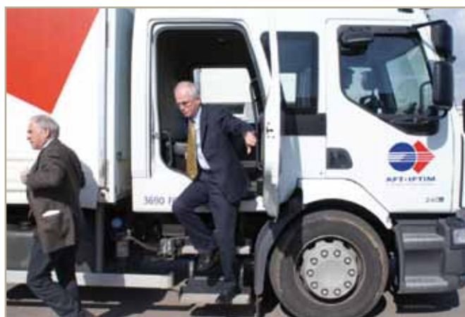
Le 2 avril dernier, le Préfet de région et le Président du Conseil régional de Bourgogne se rendent à l'AFT-IFTIM de Longvic, pour découvrir les avantages de l'écoconduite.

Cette approche «gagnant/gagnant» qui permet de concilier les impératifs économiques et la protection de notre environnement est la base de cet engagement volontaire des entreprises.